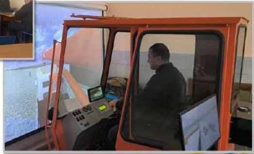
Машиніст крана автомобільного